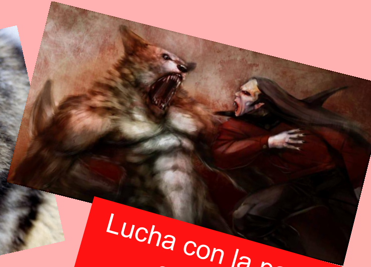
Lucha con la parte sombria